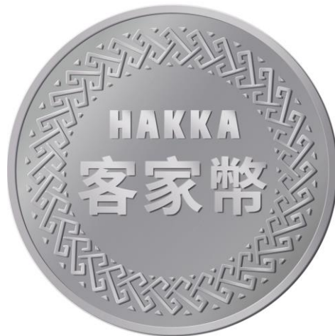
圖、「客家幣指定店」標章貼紙